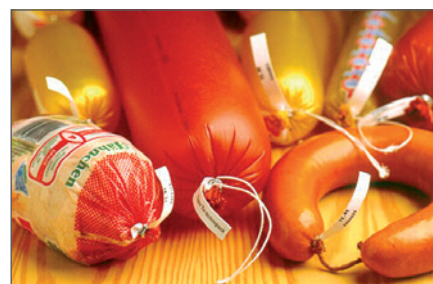
Würste mit Etiketten