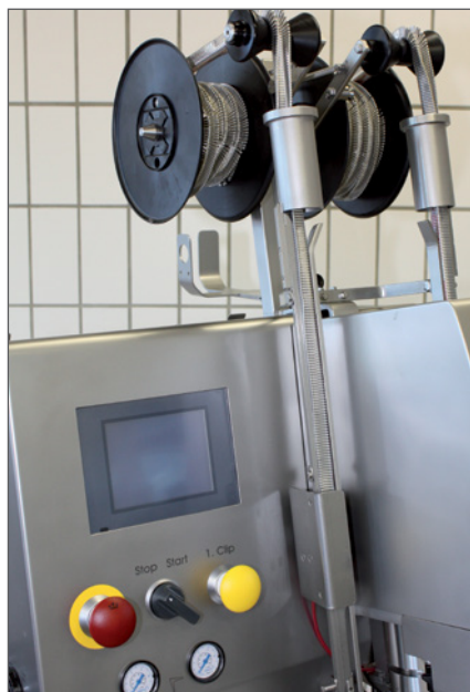
Leicht zu reinigen durch glatte Oberflächen.

Touchscreen, 50 Programme speicher- und abrufbar. Die Bedienung des KDCMA erfolgt über einen Touchscreen. Dieses moderne Bedienungssystem mit landesunabhängigen Symbolen (Icons) lässt in Bezug auf Komfort, Hygiene und Effizienz keine Wünsche offen. Die Bedienoberfläche beinhaltet die Funktionen Stoppzähler, Portionen pro Minute, Menü Systemeinstellung, Menü Maschinenschaltung, Fehlerprotokoll, Menü Produkteinstellen Fehlerposition, Schlaufe Test, Etikett Test, Anzeige des Füllerstarts.