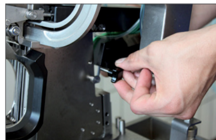
Servicefreundlich: Messerwechsel ohne Werkzeug

Das Video zum KDCMA finden Sie auf youtube.com/tippertiegroupp