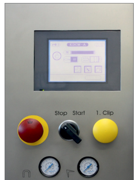
Die Bedienung des KDCMA erfolgt über einen Touchscreen.